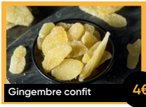
Gingembre confit 4€