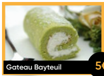
Gateau Bayteuil 5€