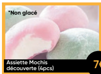
*Non glacé Assiette Mochis découverte (4pcs) 7€