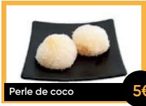
Perle de coco 5€