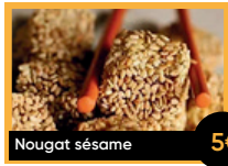
Nougat sésame 5€