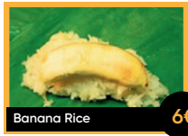
Banana Rice 6€