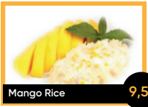
Mango Rice 9,5€