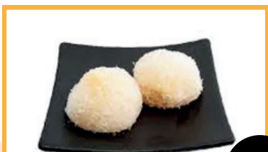
Perle de coco