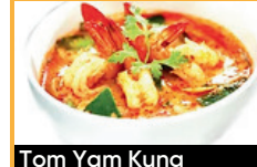
Tom Yam Kung