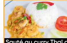
Sauté au curry Thaï avec riz