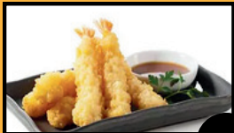
Tempuras crevette (4 pcs) 6,5€