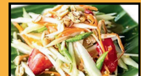
Salade de papaye Somtam Thaï 9,5€ Somtam crevette 11€