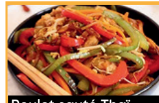
Poulet sauté Thaï