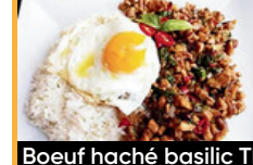
Boeuf haché basilic Thaï