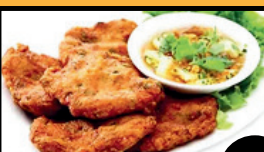
Galettes de poisson (5 pcs) 10€