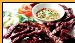
Boeuf séché Thaï 11€