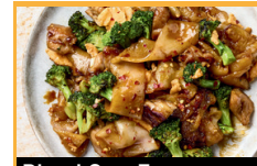
Phad See Ew