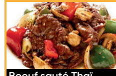
Boeuf sauté Thaï