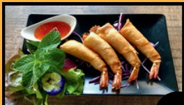
Nems crevette (4pcs) 7€