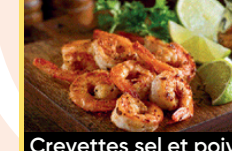
Crevettes sel et poivre