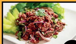
Laab boeuf cru 12,5€