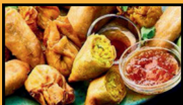
Assortiment baanthai (3 nems, 3 gyoza, 2 tempura) 12€