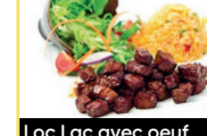
Loc Lac avec oeuf