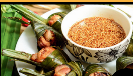
Poulet Frit Bayteuil (6pcs) 9€