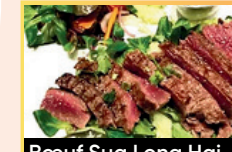
Boeuf Sua Long Hai