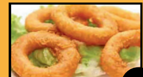
Beignets calamars (5pcs) 7€