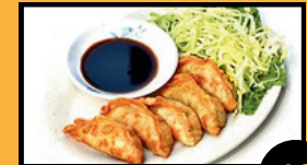
Gyoza Poulet ou Végé. (5pcs) 6€