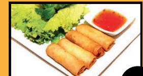
Nems poulet (4 pcs) 6€