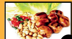
Saucisses Thaï 10€