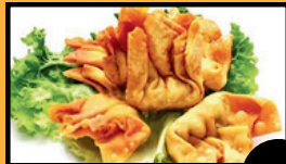
Raviolis crevette (4 pcs) 6,5€