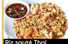
Riz sauté Thaï