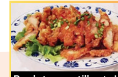
Poulet croustillant du chef