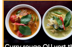
Curry rouge OU vert thaï avec riz