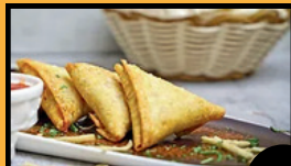
Samoussa boeuf (3 pcs) 6€